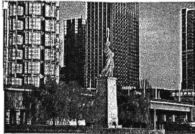
Statue de la Liberté