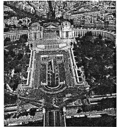
Jardins du Trocadéro

Au sud-est de la tour on aperçoit une grande étendue de pelouse: c'est le Champ de Mars ; au sud-ouest sur l'esplanade du Trocadéro se trouve le palais de Chaillot (1937) qui réunit plusieurs institutions: le musée de l'homme, le musée de la Marine, le musée des monuments français, et la cinématique.